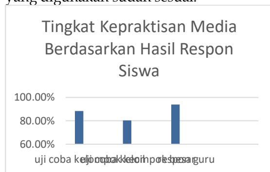
Gambar 4.5 tingkat kepraktisan media berdasarkan hasil respon siswa dan guru

bahwa tingkat kepraktisan media sebesar 94% yang menunjukkan bahwa media termasuk kategori sangat praktis digunakan dan terdapat kritikan dari guru yaitu penyampaian materi sudah tepat serta media yang digunakan sudah sesuai.